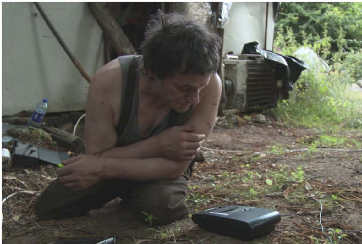
France (2010) 58 minutes Réalisé par : Antoine Boutet Directeur de la photo : Antoine Boutet Avec : Jean-Marie Massou